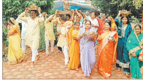
पूजा-अर्चना के बाद विरसजन के लिए जाते लोग।

की भीड़ जुटी रही। यहां भी भंडारा का प्रसाद लेने भक्तों की भीड़ लगी रही। सावन के पवित्र मास के अंतिम सोमवार 4 अगस्त को देवरहा बाबा सेवा समिति प्रेमाबाग बैकुंठपुर द्वारा भव्य धार्मिक अनुष्ठान का आयोजन किया गया। इस अवसर पर समिति द्वारा सवा लाख पार्थिव शिवलिंग का निर्माण कर प्रत्येक सोमवार को समिति द्वारा अखंड रामायण पाठ, भोग भंडारा हिस्सा है। पूजन कार्यक्रम में