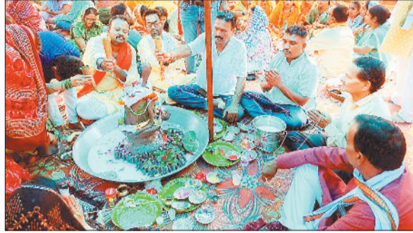
पार्थिव शिवलिंग का रूद्राभिषेक करते श्रद्धालु।